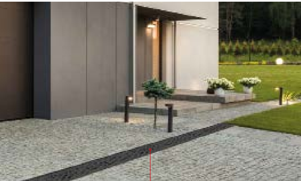
Beépítési lehetőségek a kertben, a teraszon, illetve a garázsbejáratnál