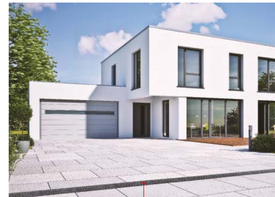
Az ACO Voronoi rács személygépjárművel terhelhető